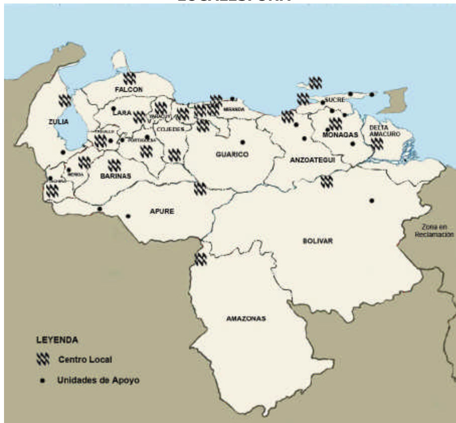
FIGURA N° 1 DISTRIBUCIÓN GEOGRÁFICA DE LAS SEDES DE LOS CENTROS LOCALES. UNA

En los actuales momentos, se encuentra en desarrollo el Macroproyecto Conectividad UNA que tiene como objetivo establecer la plataforma de comunicación física y temática requerida por la